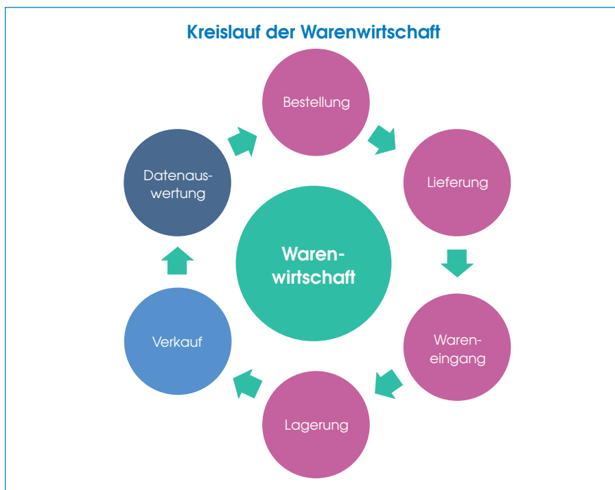
Abb.: Kreislauf der Warenwirtschaft

Die Warenwirtschaft ist ein Teilbereich der Betriebswirtschaft und umfasst alle Vorgänge, die für Warenbewegungen erforderlich sind. Dazu gehören Bestellvorgänge, Lieferungen (Versand, Transport), Bearbeitung des Wareneingangs sowie Lagerung, Verkauf und regelmäßige Datenauswertung. Zur Prozessoptimierung sind fortlaufende Datenanalysen und Auswertungen erforderlich.